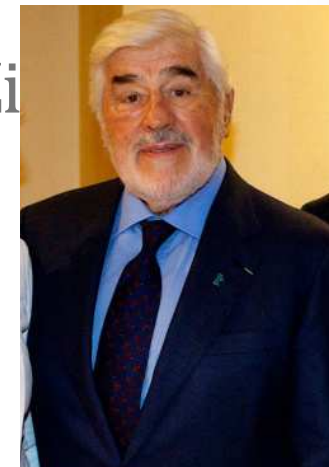
Gäste im Berlin Capital Club