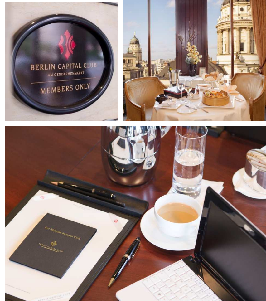
Einblick in den Berlin Capital Club

Der gehobene Anspruch in Verbindung mit stilvoller Eleganz von Germany's Leading Business Club spiegelt sich auch in unserem in unserem hochwertigen Veranstaltungskalender mit hervorragender Druck- und Papierqualität sowie einem modernen Layout und interessanten Inhalten wider.